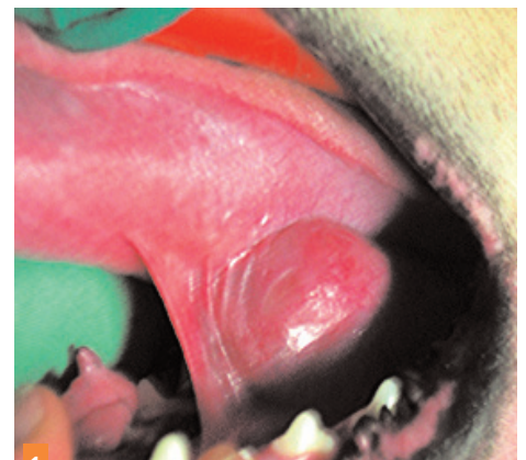
1 Masse sous-linguale située à gauche observée lors de l'ouverture de la cavité buccale.

1 Quelles sont vos hypothèses diagnostiques ?