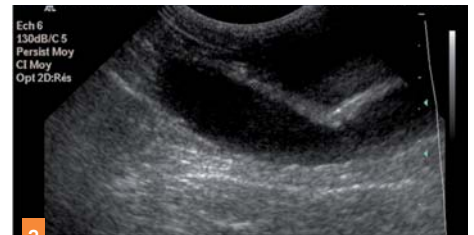
2 Dilatation de la lumière utérine.

res hypoéchogènes de 7 mm compatibles avec des corps jaunes.