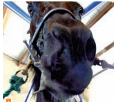
2 Le naseau droit apparaît quasi-complètement collabé pendant la récupération d'un exercice d'intensité submaximale.

1 De quelle structure anatomique suspectez-vous l'atteinte ?