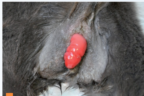
1 Prolapsus rectal chez un chat - Noter l'aspect tubulaire, signifiant que toute l'épaisseur de la paroi du rectum est extériorisée.

● Les animaux présentés pour prolapsus anal ont une muqueuse rouge et gonflée qui fait protrusion par l'anus après la défécation.