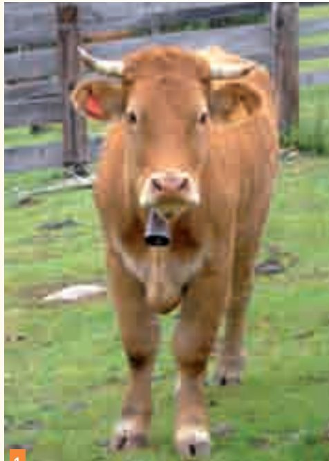
1 Œdème des antérieurs marqué.

Il ne semble pas abattu, il est alerte et seule sa démarche semble ralentie.