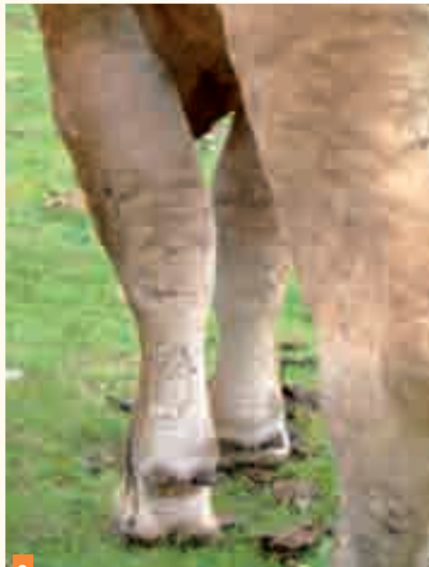
3 Œdèmes des quatre membres.

L'observation des mouvements respiratoires, ainsi que l'auscultation cardiopulmonaire, ne permettent de déceler aucune anomalie. Les nœuds lymphatiques ne sont pas hypertrophiés.