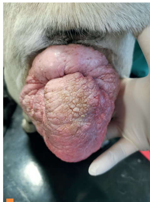
2 Ptose vaginale de stade 3 chez un Carlin de 8 ans. - Aspect moins classique avec aberration extrême du plancher vaginal (photos Service de reproduction, ENV Alfort).