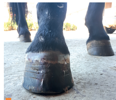
2 Face du pied antérieur droit : noter la déformation de la boîte cornée en pince.