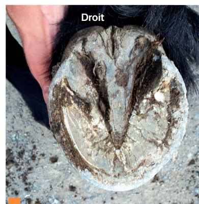
1 Vue comparative des pieds antérieurs gauche et droit (vue palmaire). Antérieurs gauche et droit : noter la pince nettement plus en pointe sur l'antérieur droit.