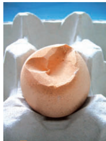
2 Fragilité de la coquille au niveau de l'apex.

des sacs aériens. Le syndrome est plus marqué (davantage d'œufs anormaux) si les poules sont infectées par M. synoviae et par le virus de la Bronchite infectieuse (BI).