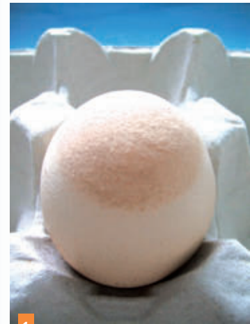
1 Aspect d'œufs issus d'un élevage de poules pondeuses ayant développé le syndrome des œufs à extrémité de verre. - Calotte caractéristique au niveau de l'apex (photo Anses laboratoire de Ploufragan).